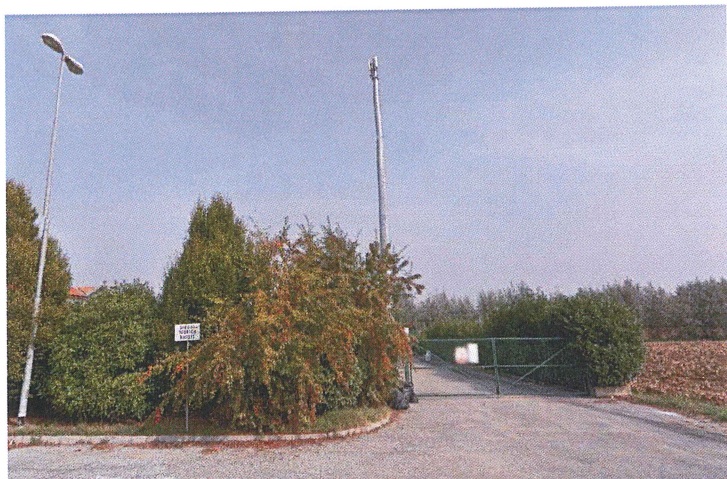
Stazione Radio base da Via del Cimitero