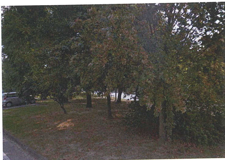
Area verde Via Borsellino