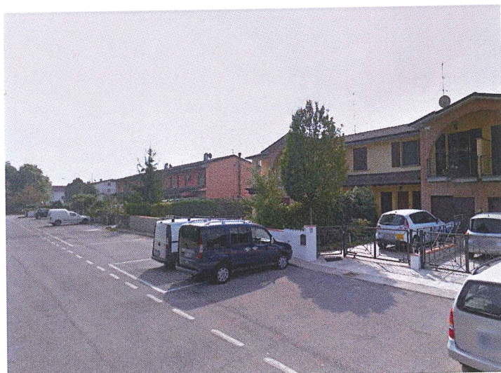
Parcheggio Via Borsellino