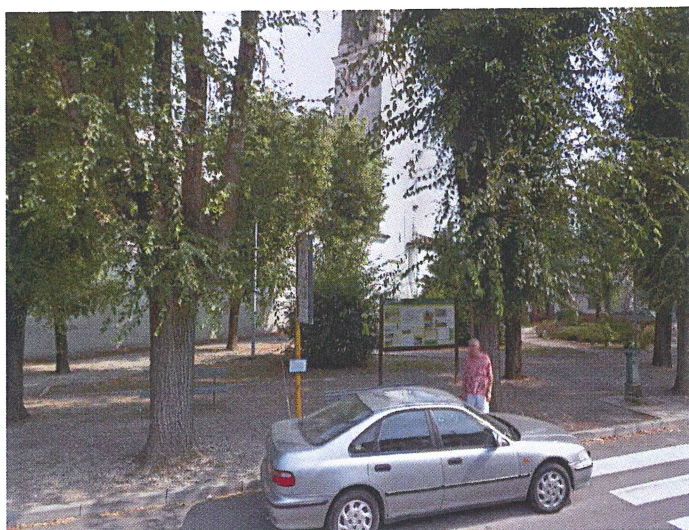
Ingresso da Via Quaini