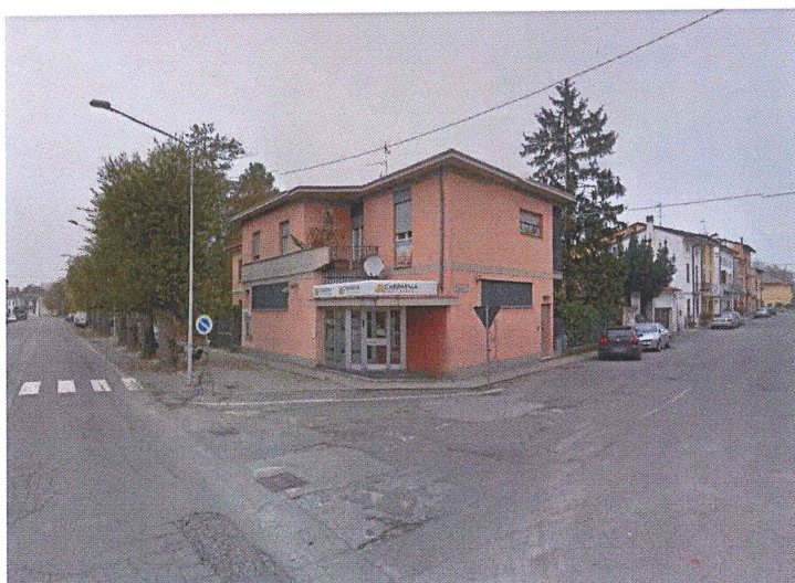
Ingresso da Via Quaini