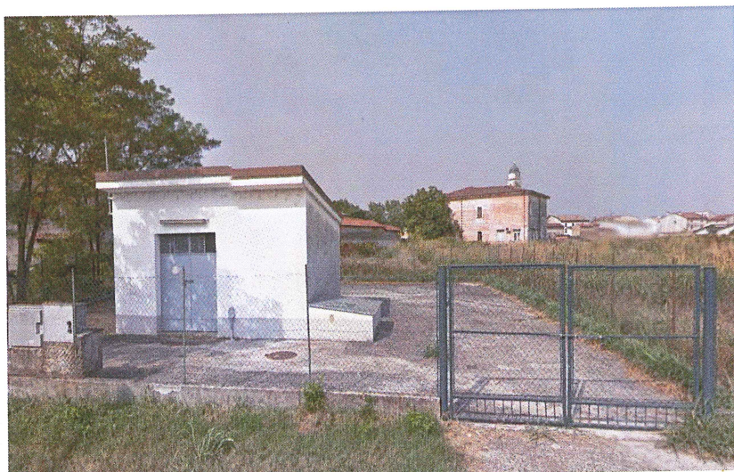
Vista da Via I Maggio