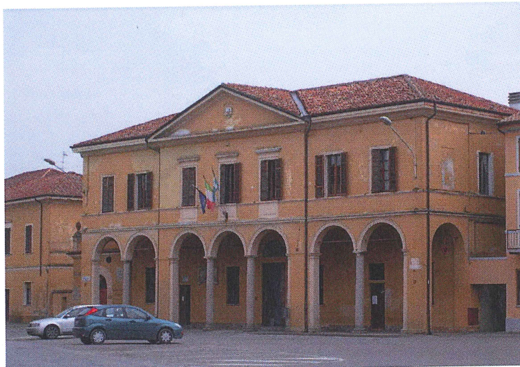
Ingresso da Piazza XXV Aprile