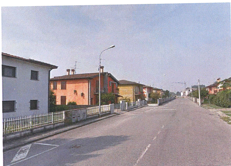
Parcheggio Via della Repubblica