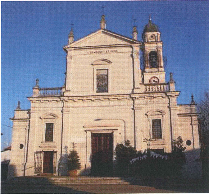
Oratorio da Piazza XXV Aprile