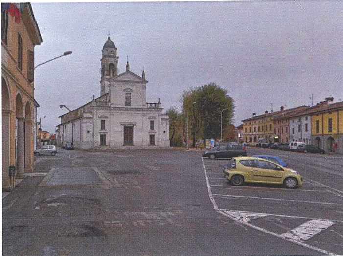
Ingresso da Via Quaini