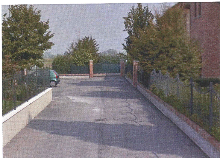
Parcheggio Via Borsellino