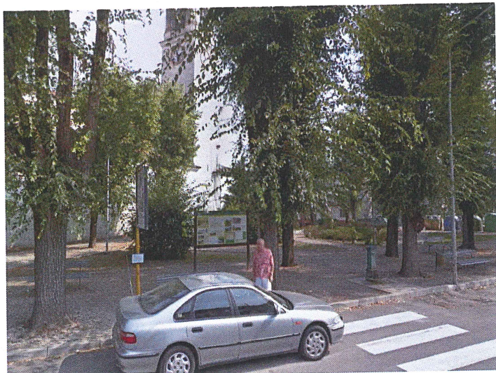
Ingresso da Via Quaini