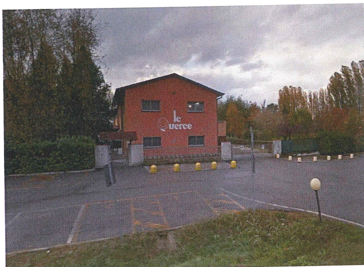
Ingresso del Centro sportivo