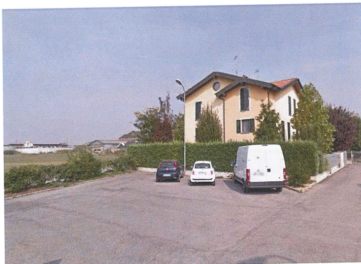
Parcheggio dalla I Traversa Via Borsellino