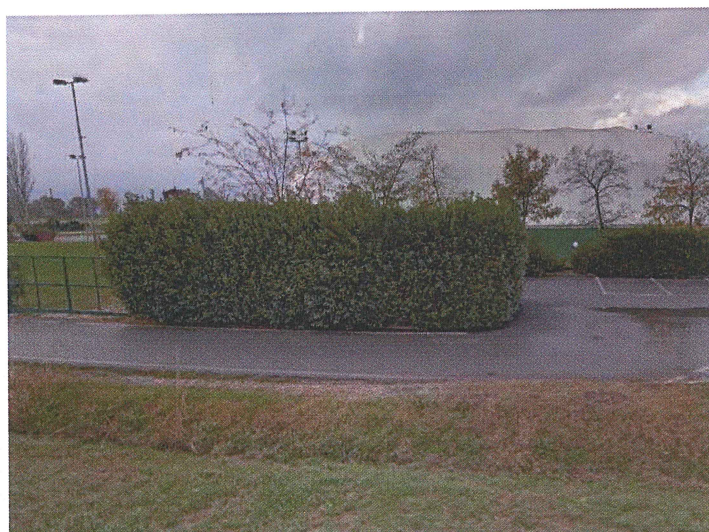
Parcheggio del Campo Sportivo