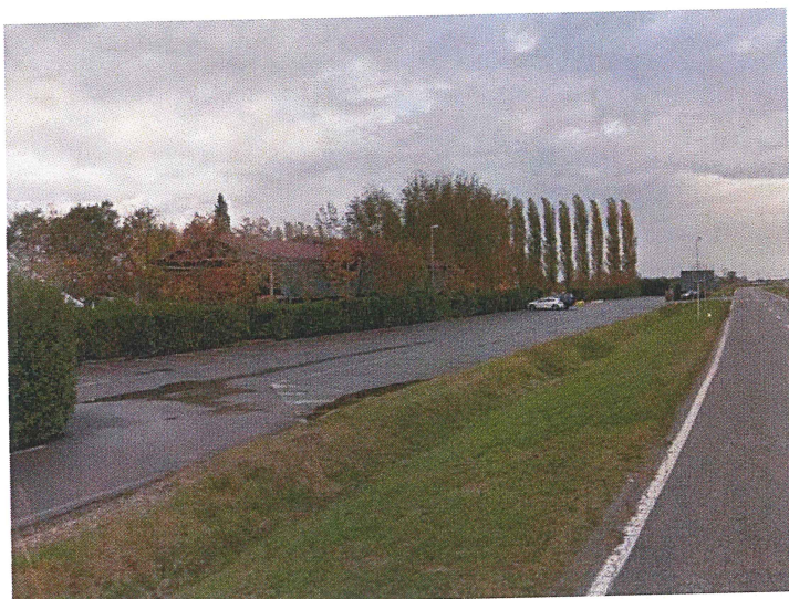
Parcheggio del Campo Sportivo