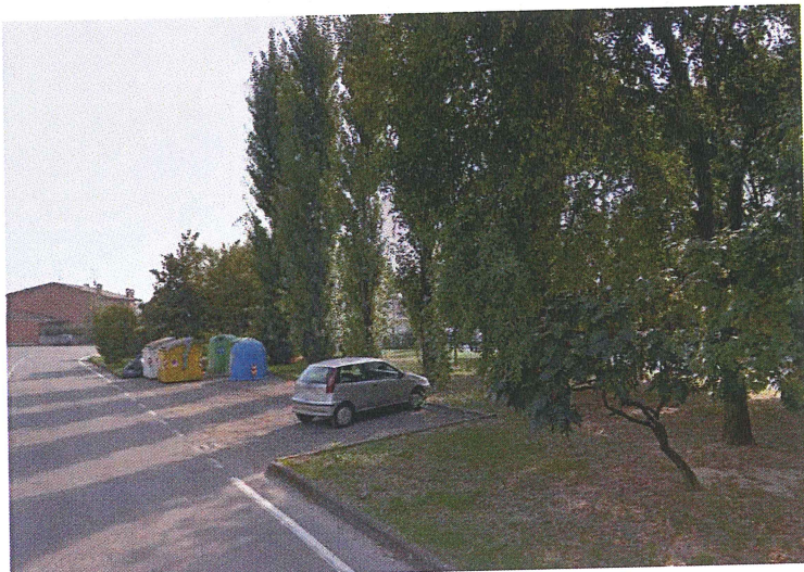
Parcheggio Via Borsellino