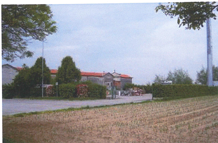
Ripresa da via del Cimitero