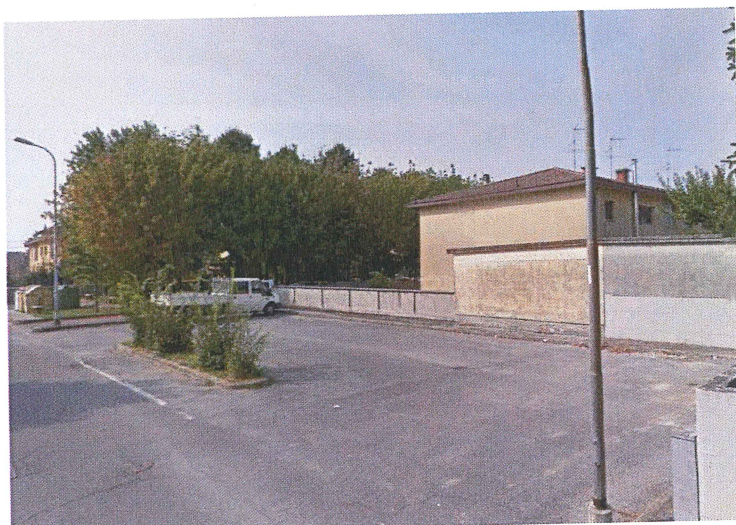
Parcheggio Via Monteverdi