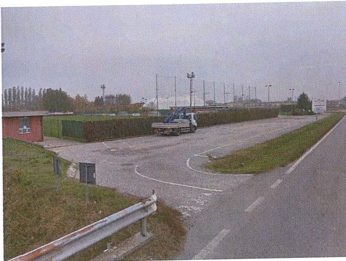
Parcheggio del Campo Sportivo