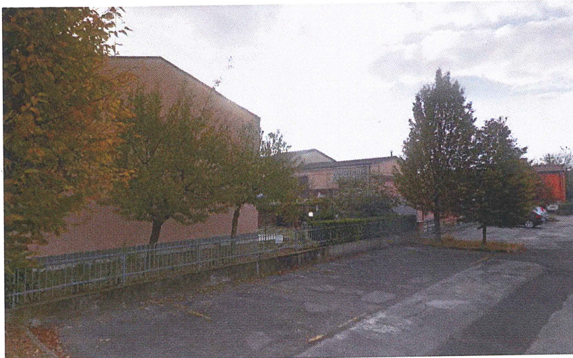
Vista da Via I Maggio