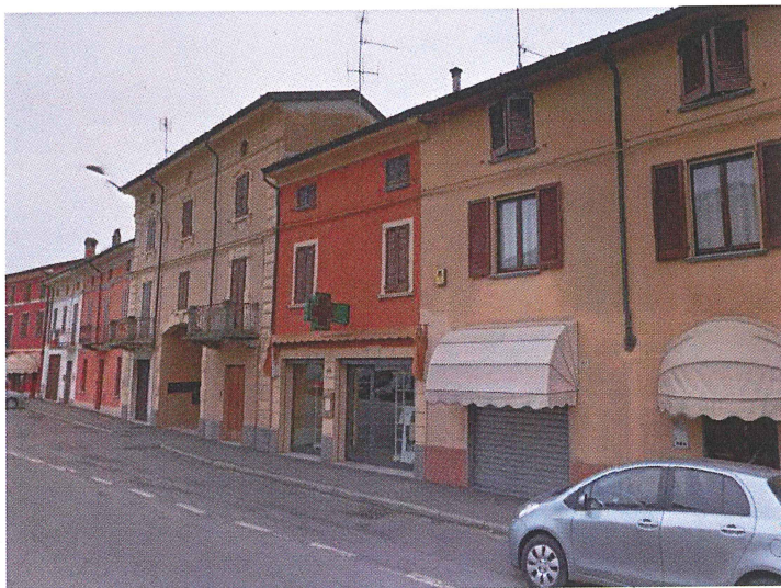
Ingresso da Via Quaini