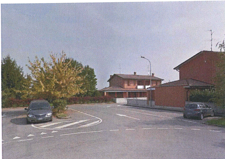
Parcheggio Via Monteverdi