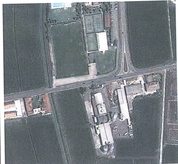
Ortofoto Parcheggio del Campo Sportivo