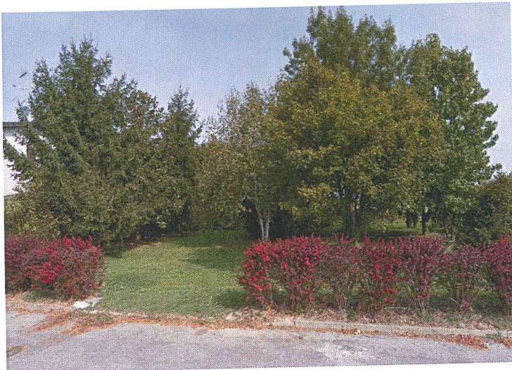
Accesso area verde Via Monteverdi