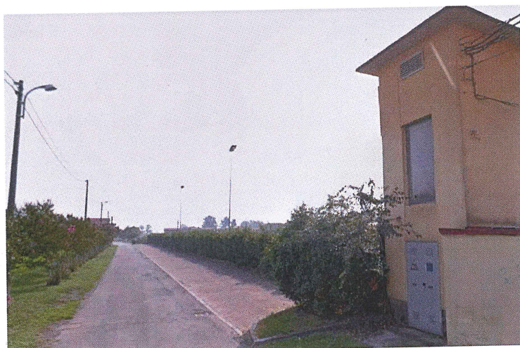
Parcheggio Viale della Rimembranza