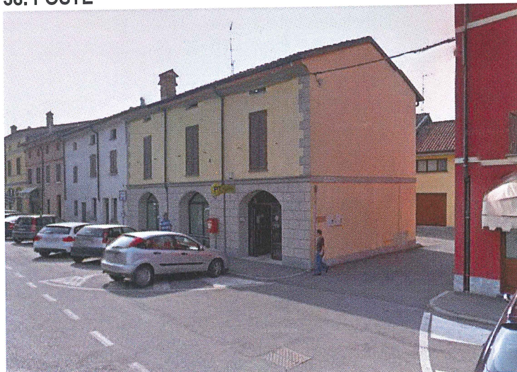
Ingresso da Via Quaini