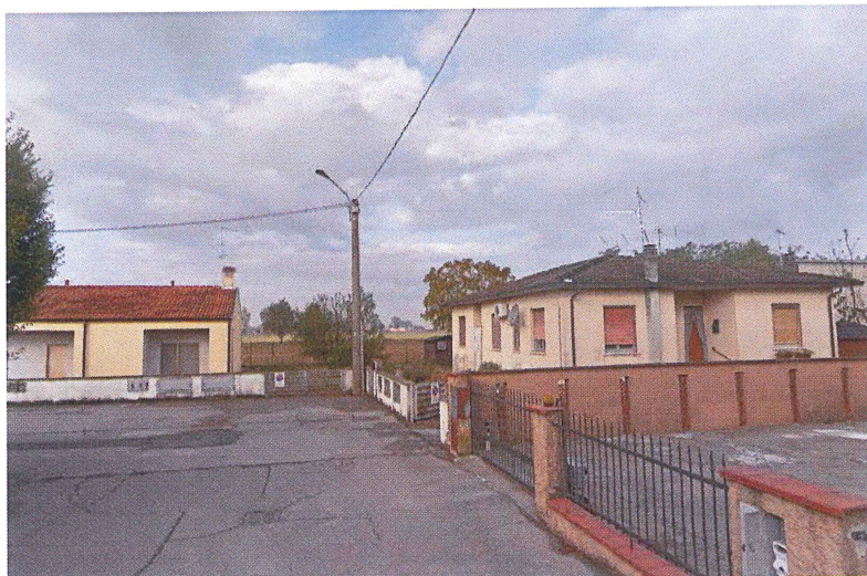
Vista da Via I Maggio