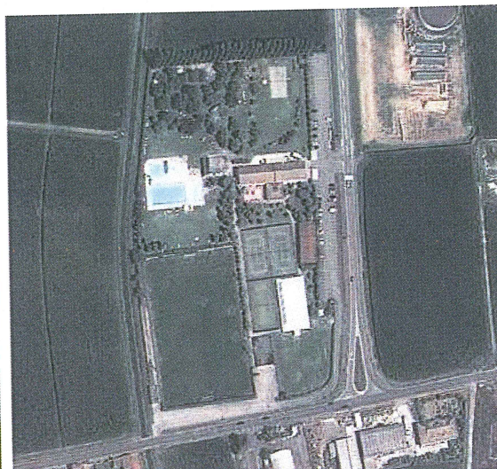
Ortofoto Centro sportivo