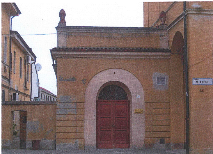
Ingresso da Piazza XXV Aprile