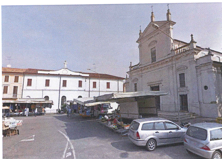
Oratorio da Piazza XXV Aprile