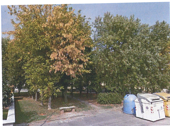
Accesso Area verde da Via Monteverdi