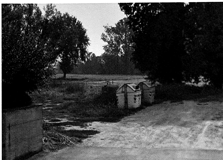
Vista da Via Cavalli