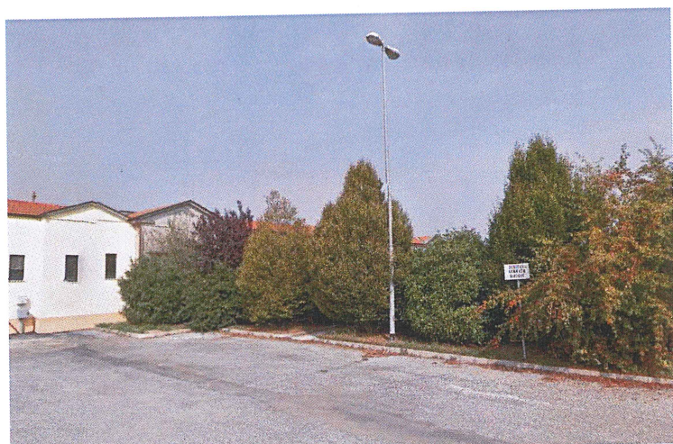
Area adibita a parcheggio del Cimitero