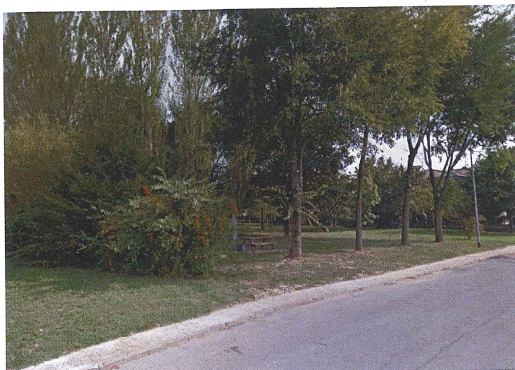
Area verde Via Borsellino