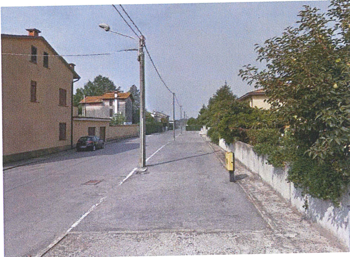
Parcheggi di Viale della Rimembranza