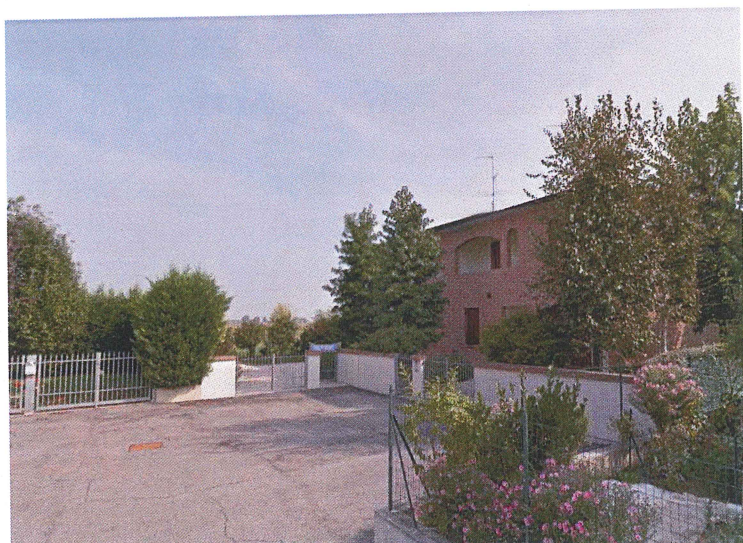
Parcheggio I Traversa Via Borsellino