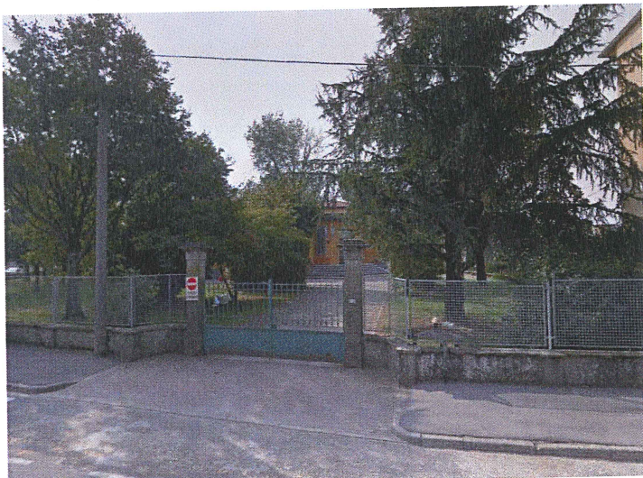
Ingresso della Materna Via Quaini